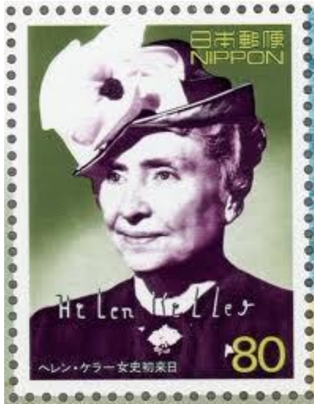
ヘレン・ケラー（1880.6～1968.6） 盲ろう者で大学教育を 修めた世界最初の人