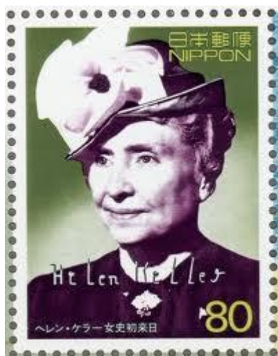
ヘレン・ケラー（1880.6～1968.6） 盲ろう者で大学教育を 修めた世界最初の人