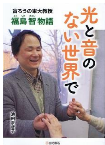
福島智（1962.12～） 盲ろう者で大学教授に なった日本最初の人