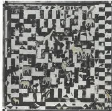
「サファリの夜」合作