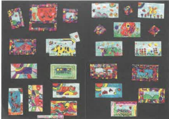
「生きもの達」池本伸治