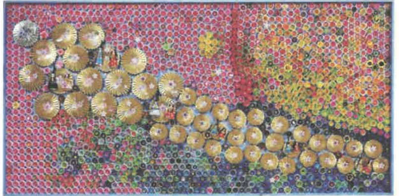
「用瀬流しびな」合作