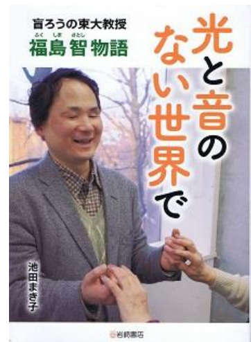
福島智（1962.12～） 盲ろう者で大学教授に なった日本最初の人