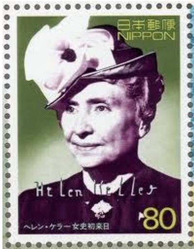
ヘレン・ケラー（1880.6～1968.6） 盲ろう者で大学教育を 修めた世界最初の人